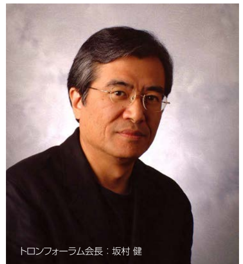
トロンフォーラム会長：坂村 健

2015年5月には坂村会長が、ユビキタス・ネットワークやIoTの起源となったオープンアーキテクチャ TRONを提唱したことにより、アジアからただ一人、ビル・ゲイツ氏らとともにITU150周年賞(*)を受賞するなど、その活動内容は世界的にも高い評価を得ています。